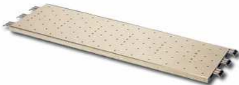
5. PODINA METALICA ZINCATA