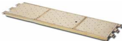
6. PODINA METALICA CU TRAPA