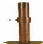
4. PICIOR BAZA REGLABIL